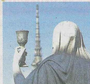
Il Sacro Graal alla Gran Madre