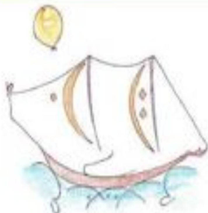
Nawaz Zubaria - Classe 4 a L - ex aequo