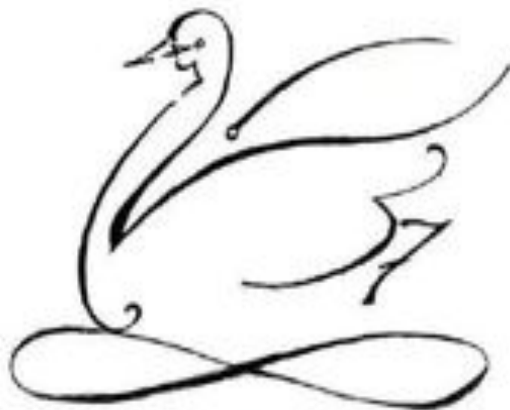
Ornella Zen - Il Cigno