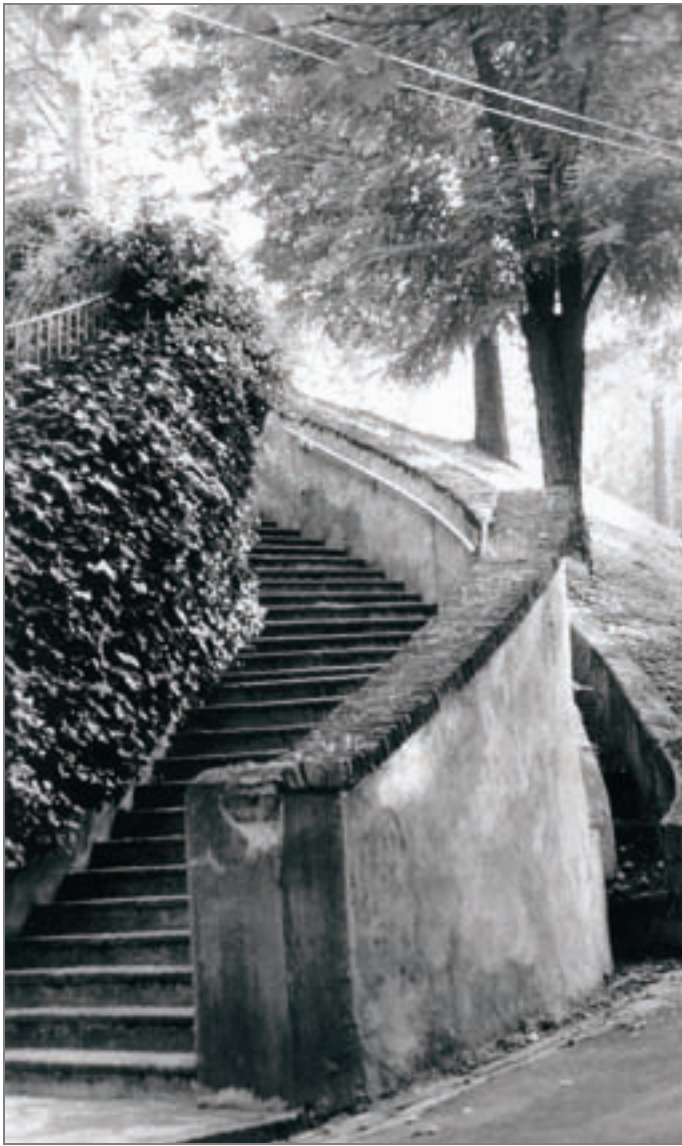
Strada comunale di San Vito