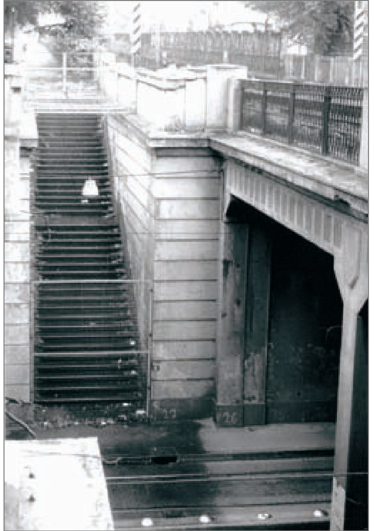
Sottopasso Corso regina Margherita