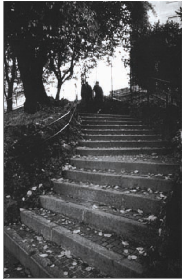
Via san Donato – Via A. Del Sarto