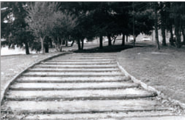
Corso Dogliotti - Via Santena