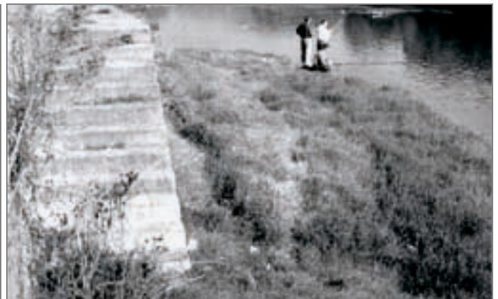
Lungo Po Machiavelli