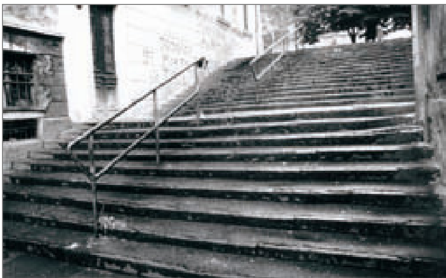
Vicolo Grosso - Corso regina Margherita