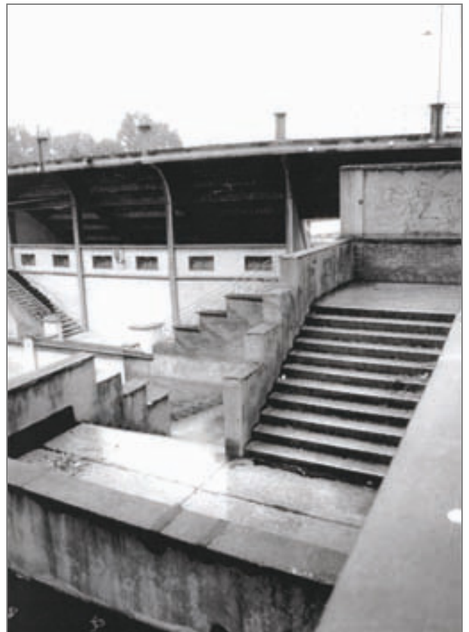
Corso Casale - Motovelodromo