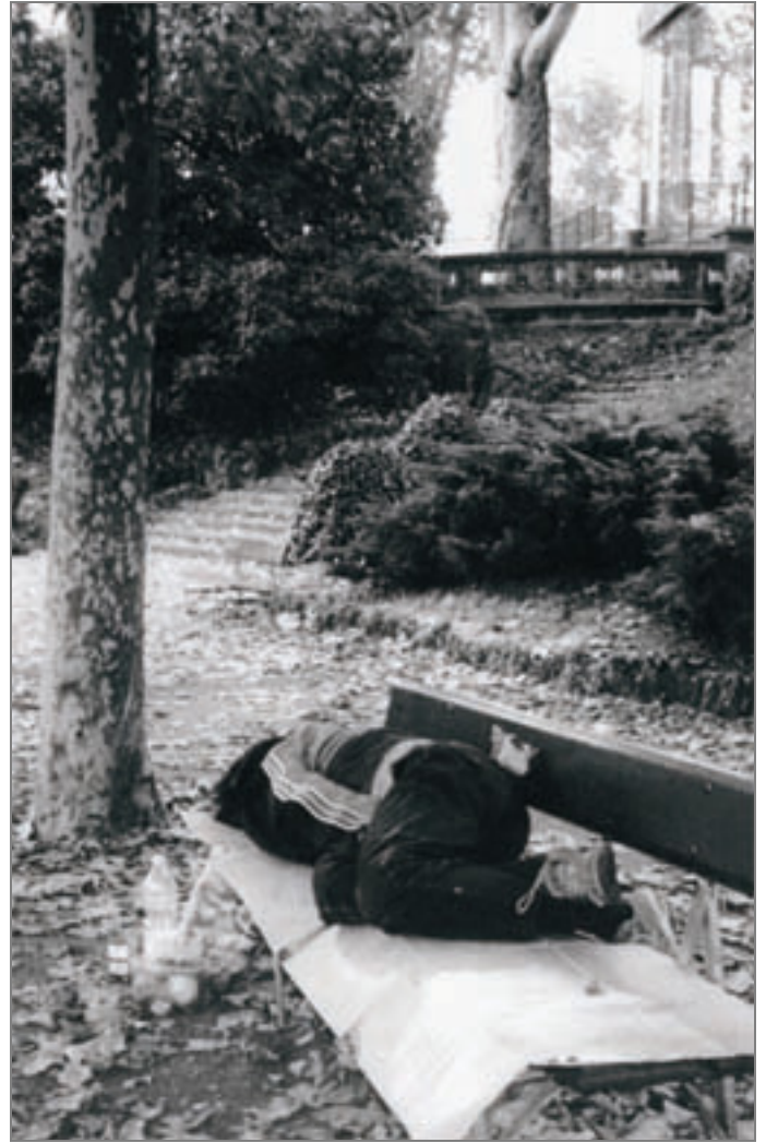
Parco del Valentino – Fontana dei Mesi