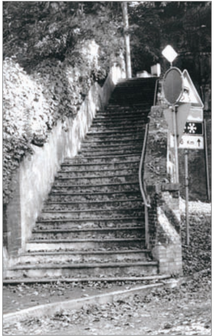
Corso Lanza - Strada comunale di San Vito