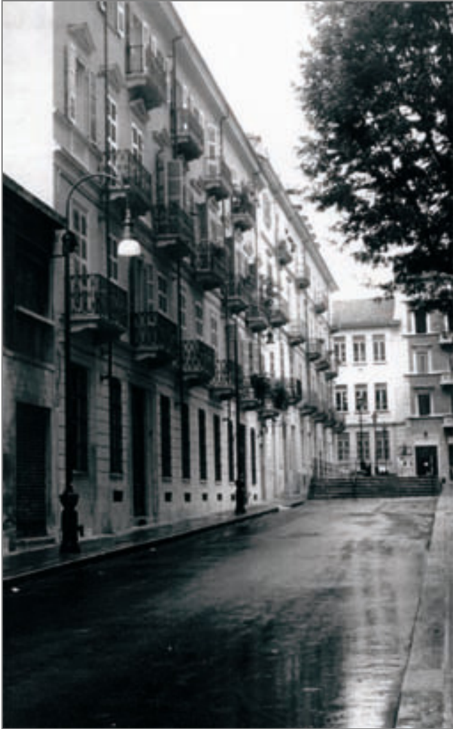
Via Riberi - Mole Antonelliana