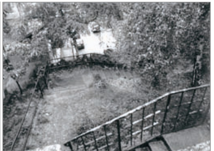
Corso Lanza - Via Palladio