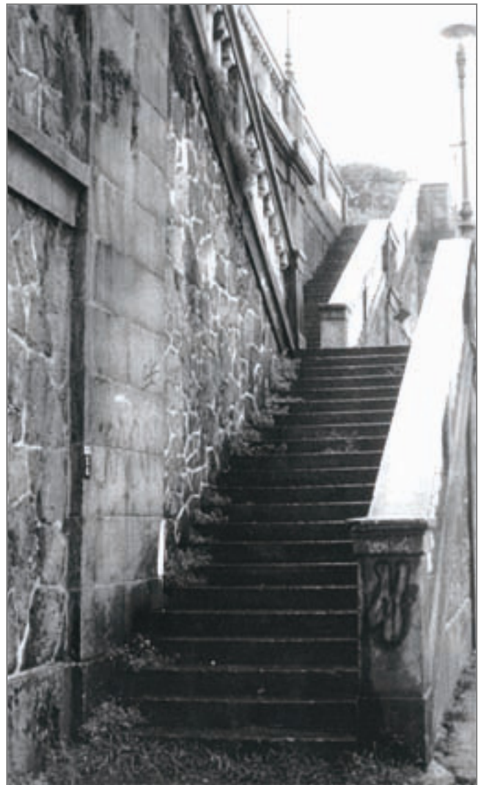
Corso Quintino Sella