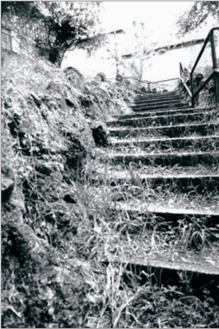
Corso Lanza – Via Palladio